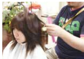
●美容室や理髪店で