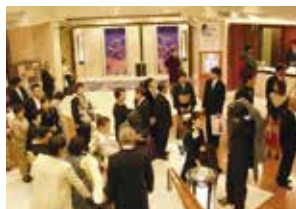
●ホテルや結婚式場で