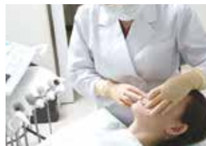
●病院や歯科医院で