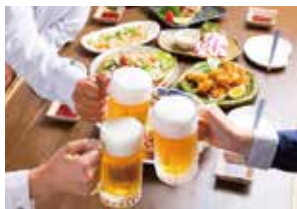
●居酒屋やファミリーレストランで